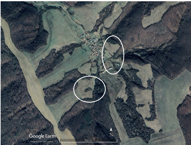
Obrázok 6. Študijná plocha v okolí obce Potôčky.

Všetky zaznamenané druhy motýľov boli zaradené do príslušných čeladi podľa systematickej klasifikácie (Pastorális 2022).