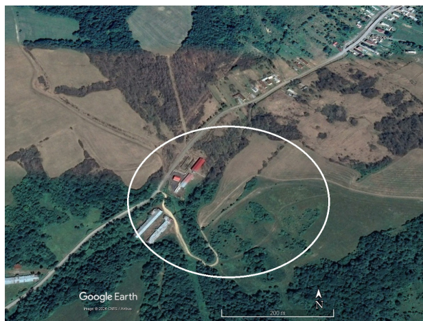
Obrázok 5. Študijná plocha v okolí obce Veľkrop.