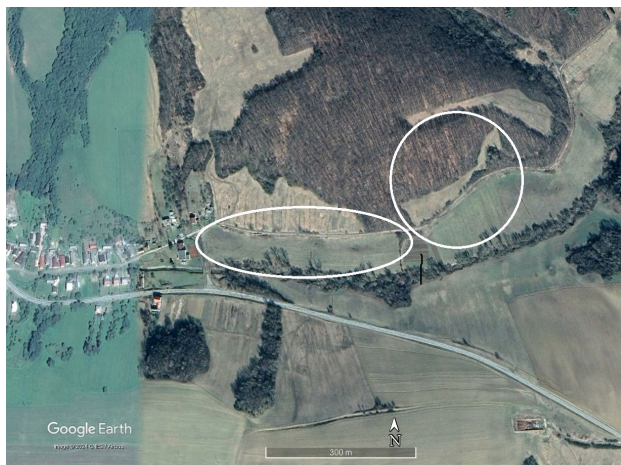
Obrázok 2. Študijná plocha v okolí obce Kručov.