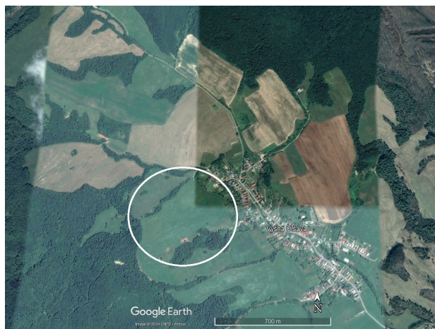
Obrázok 3. Študijná plocha v okolí obce Vyšná Olšava.