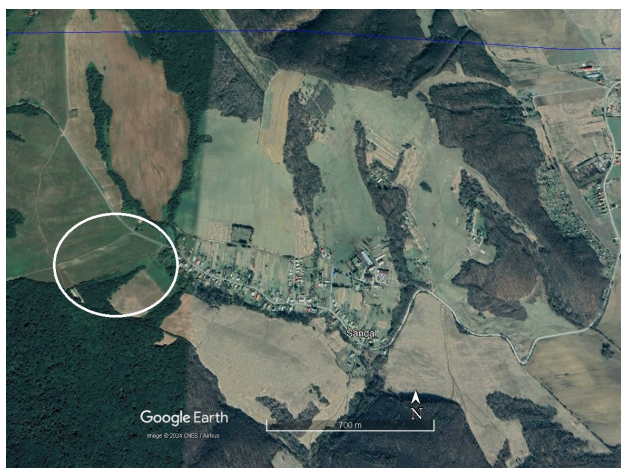
Obrázok 1. Študijná plocha v okolí obce Šandal (Zdroj: Image©2024 CNES / Airbus, Image©2024 Maxar Technologies).

Motýle boli predovšetkým zaznamenané na lúčnych stanovištiach a biotopoch, ktoré sú typické ich najčastejším výskytom. Okrem toho, bola pozornosť sústredená aj na rôzne krovité zárasty, ruderálne plochy, remízky, okraje lesných, poľných, vodných či podmáčaných biotopov. Všetky zaznamenané letiace resp. sediace jedince boli determinované priamo teréne. Odchyteným jedincom boli šetrným spôsobom zotrené krídelné šupiny na apexe krídel (tzn. vrchol, predný roh krídla motýľa) tak aby nedošlo k poškodeniu krídel a aby sa predišlo ich opätovnému spočítaniu. Údaje o výskyte druhov boli zaznamenané do terénneho protokolu a len v nevyhnutnom prípade boli ťažko určiteľné druhy odoberané k ďalšiemu laboratórnemu spracovaniu kopulačných orgánov a determinované pomocou určovacích kľúčov a atlasov (Jakšič 1998; Slamka 2004).